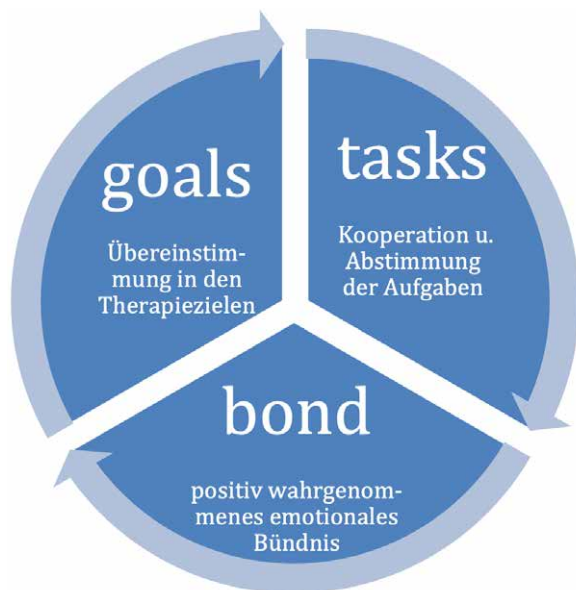
Abb. 1: Drei zentrale Komponenten starker Arbeitsbeziehungen (nach Bordin, 1979)

Ich finde das Konzept sehr anschlussfähig für die Therapieberufe. In einer Befragung logopädischer Expert*innen in Deutschland hat es auch viel Zustimmung gefunden (Schlüter et al., 2020). Und es ist aber auch gleichzeitig ein sehr breites Konzept, weil man damit ja auch die Ebene der Ziele und die Ebene der Gestaltung oder Planung mit im Beziehungskonzept hat. Ich finde es aber trotzdem sehr ansprechend. Das Konzept passt zu Entwicklungen in der Logopädie, die z.B. in Richtung partizipative Zielfindung gehen. Wie siehst du die Anschlussfähigkeit? Das würde mich sehr interessieren.